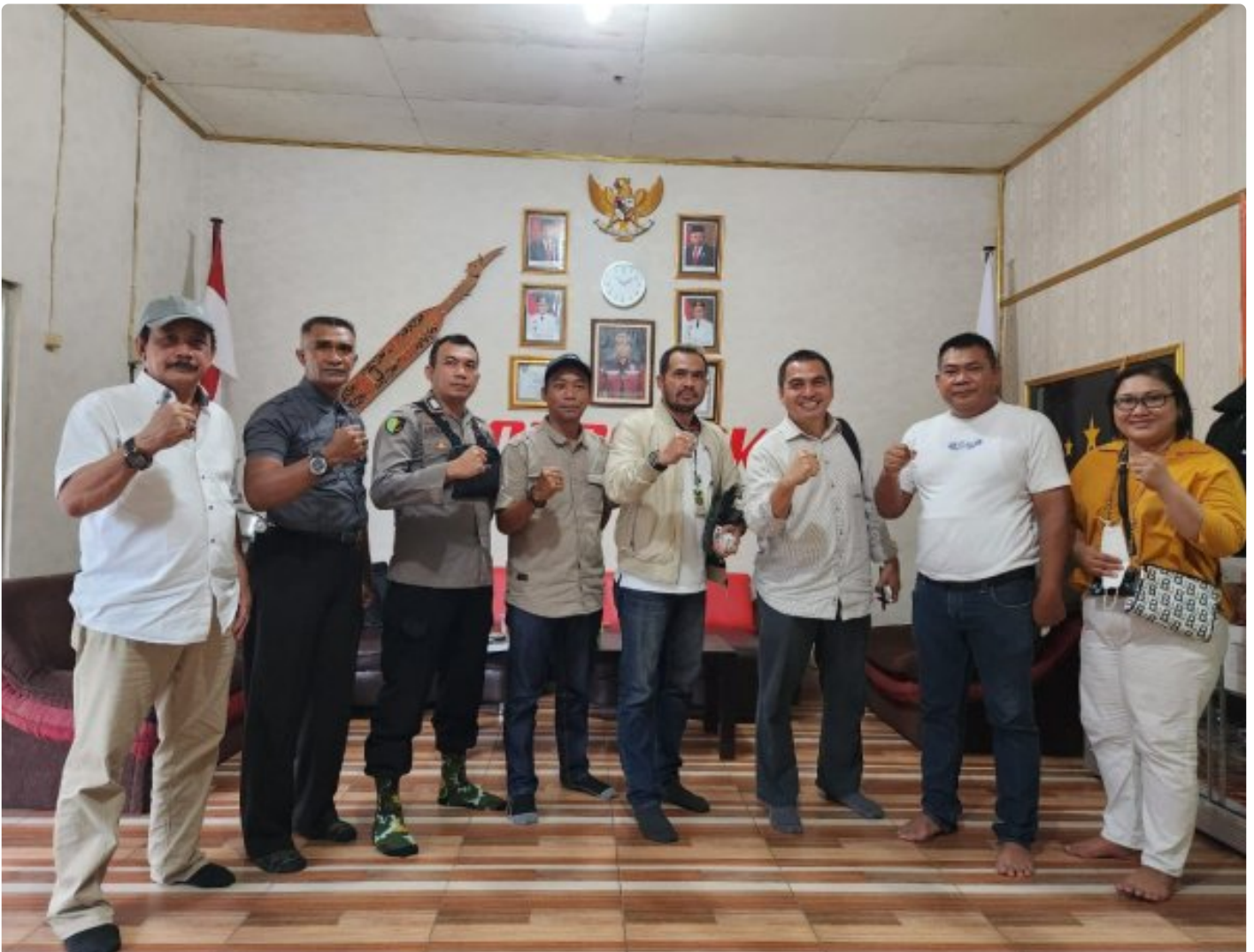
Tim PT Agasa Kalimantan Tengah

PALANGKA RAYA - PT Agasa Kalimantan Tengah (PT Agasa Kalteng) merupakan Badan Usaha Jasa Pengamanan (BUJP) Perusahaan lokal Kalimantan Tengah yang bergerak di bidang industri security, meliputi "Jasa